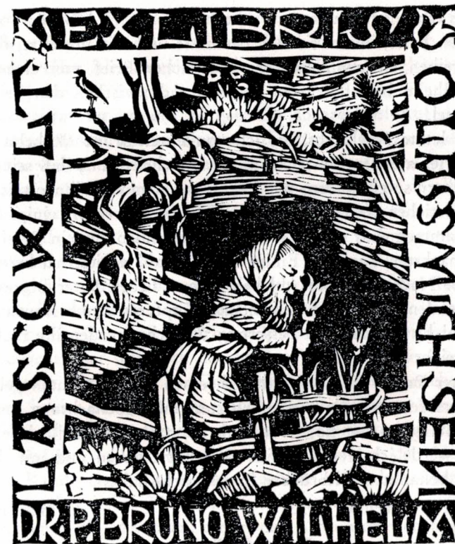
Exlibris des P. Bruno Wilhelm mit dem Motto «Laß, o Welt, o laß mich sein». Holzschnitt aus den dreißiger Jahren von Professor Switbert Lobisser von Klagenfurt.

Ein andermal, wir trafen uns gerade an der Pforte, sagte er, ich möchte ihn begleiten, er gehe zum Buchhändler. Er kam mir unruhig vor und als ich ihn fragte, was er denn so eilig in der Buchhandlung zu tun habe, erklärte er, daß zu Mittag aus einem Buche vorgelesen werden solle, das er nach auswärts ausgeliehen habe, und das brauche niemand zu wissen.